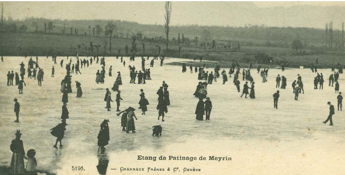
Etang de Patinage de Meyrin